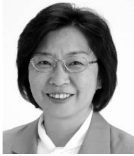
市議会議員 鈴木まさ子