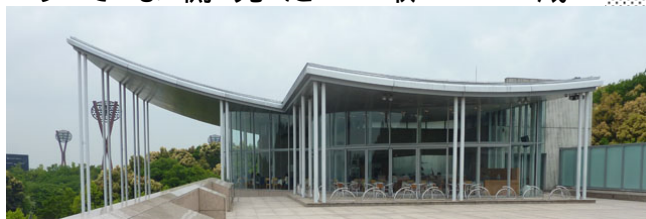
美術博物館屋上のセレーノ

14年にアイエヌジーの社員4人が、株式を取得することで、市から独立した会社として、先の2店舗を市側の協議(公募なし)で経営していました。りぶらのレストランを入札(プロポーザル式)によって落札し、昨年4月からタイガーカフェにかわってレストラン「セントルイス」を運営していました。現在株主は社員1名でした。