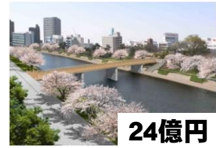
24億円 殿橋と明代橋の間に幅17mの人道橋(18億円)をかけ、中央緑道を通り籠田公園へ遊歩道