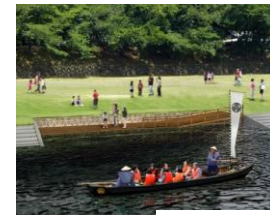
1.6億円 五万石舟10艘、貸しボート・カヌーなど年間通して運営