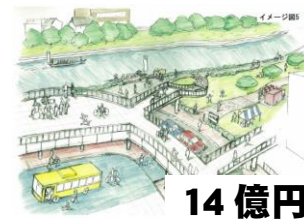
14億円 東岡崎駅前交通広場(予定)の上にペDESTリアンデッキをつくり乙川を眺望