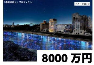
8000万円 家康生誕祭に3万5千個の電球を乙川に流す