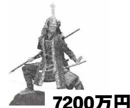
7200万円 徳川四天王の石像を籠田公園への遊歩道に設置